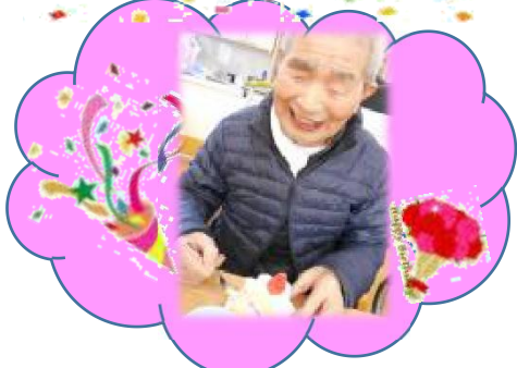
S・Y さま 昭和4年2月10日生 93歳になられました。 おめでとうございます。 これからもお元気でいてくださいね。