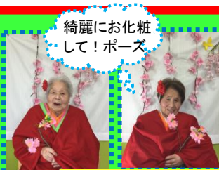
綺麗にお化粧して！ポーズ