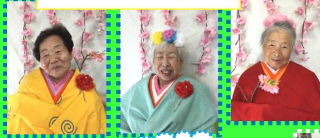
上手にできたやろ？