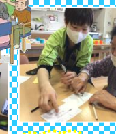
小学校で習った漢字だね