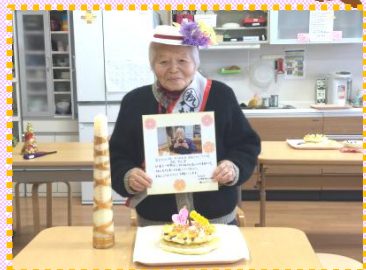
T・A様 1月11日生まれ お誕生日 おめでとうございます。