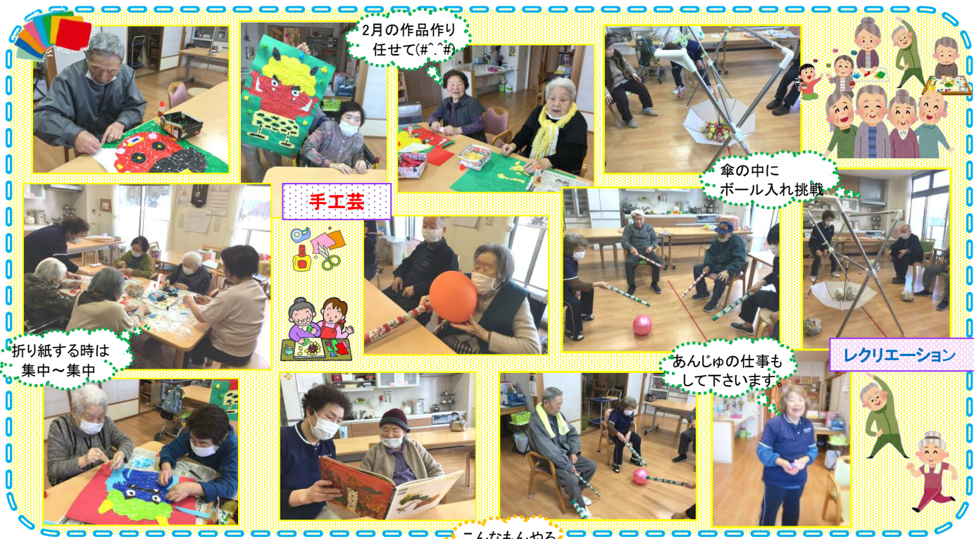
2月の作品作り任せて(#^_^#)